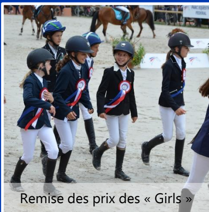
Remise des prix des « Girls »